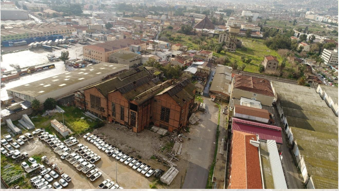
Resim3. Elektrik Fabrikası'nın mevcut durumu