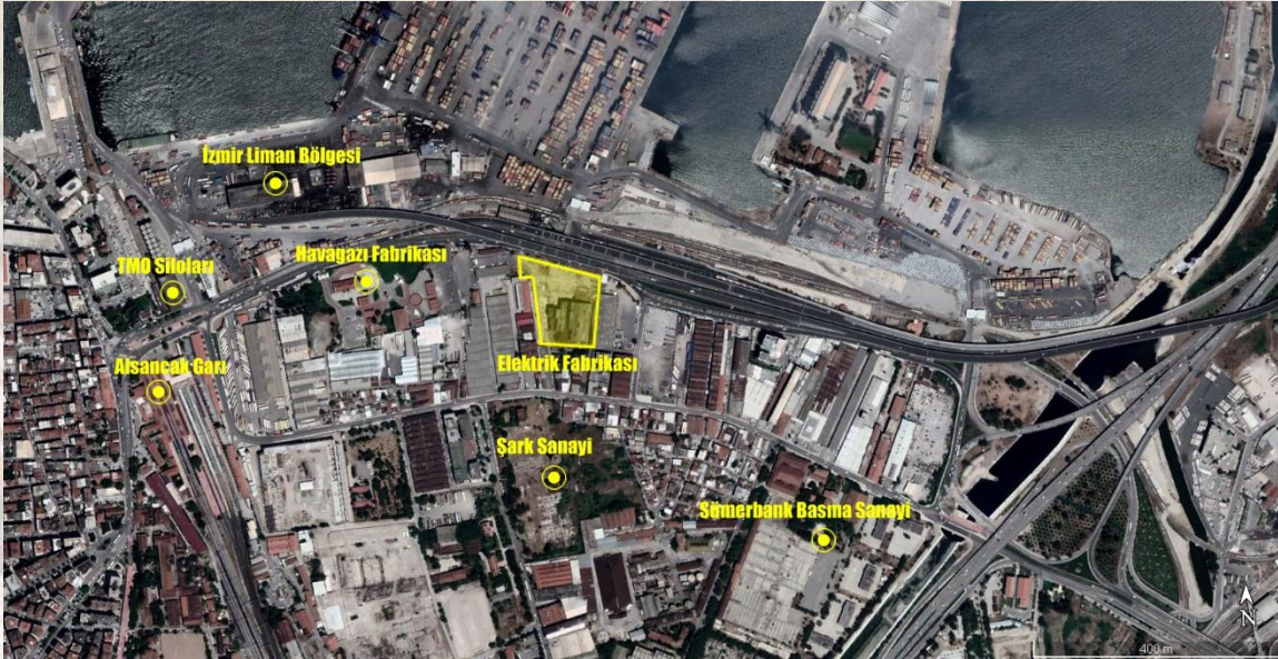
Resim1. Yarışma alanının içinde bulunduğu kentsel ortam.

İzmir Elektrik Fabrikası'nın üzerinde konumlandığı 3535 ada 6 parsel, Konak ilçesi Umurbey Mahallesi 1505 Sokak'ta ve kentsel bellekte önemli bir ize sahip olan Alsancak Liman Arkası Bölgesi'nde yer almaktadır. Yarışma alanı kuzeyde Liman Caddesi, doğu ve batıda depo alanları, güneyde küçük ölçekli üretim yapıları ve konutlar ile çevrilidir. Yapı 11.000 m 2 lik bir alan üzerinde yer alır ve mevcut durumda 4875 m 2 kapalı alana sahiptir.