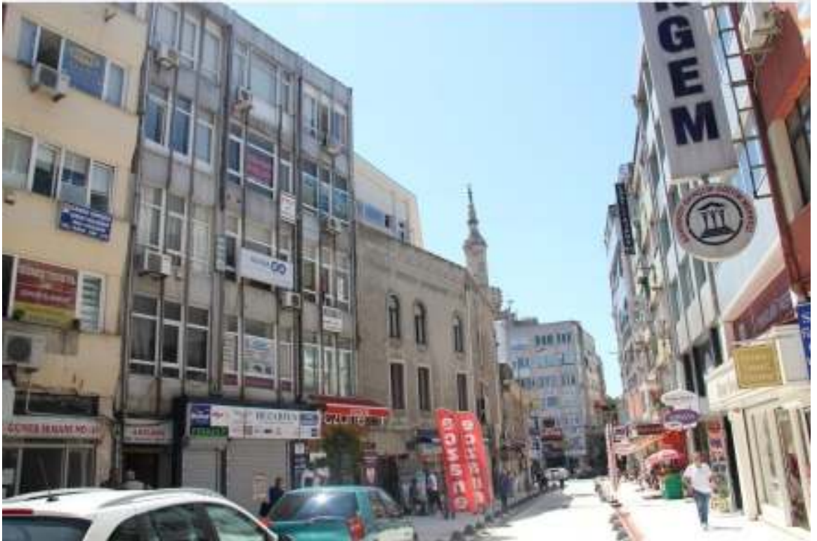
Resim: Yapraklı Adasının geçmiş ve günümüzdeki hali.