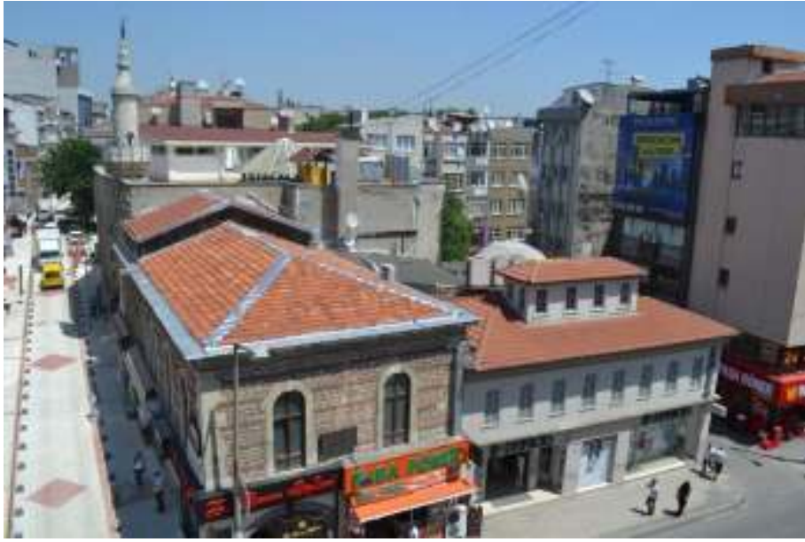
Resim 1. İstanbul Caddesi’nden Bakırköy Çarşı Camisi ve çevresi (95 no’lu ada)

Yarışmacıların, yüzyıllardır kentin sosyokültürel yaşamına katkı sağlayan bu yapıları/dokuyu göz ardı etmeden, çağdaş kent yaşamını zenginleştirecek yeni ve yaratıcı kullanım önerileri geliştirmesi beklenmektedir.