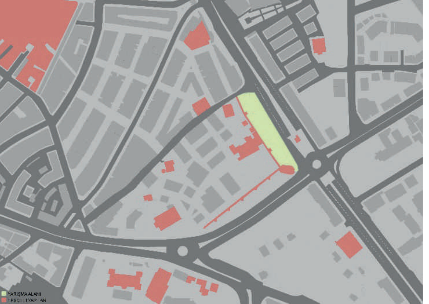
Resim 4. Yarışma alanı ve yakın çevresi

Yarışmaya katılmak isteyenler yarışma adını “Kayseri Melikgazi Buluşma Noktası Ulusal Fikir Yarışması” açıklaması ile 100 TL’yi (Yüz Türk Lirası) idari iletişim bilgilerinde verilen banka hesabına yada elden Melikgazi Belediyesi tahsilat veznelerine isim bilgisi ile yatıracaktırlar. Yarışmacılar, şartname bedelini yatırdıklarına dair banka ödendi belgesinin taranmış kopyasını, adı, soyadı, açık posta adresi, telefon, faks ve e-posta adresleri ile birlikte yarışma raportörlüğü e-posta adresine ( yarisma@melikgazi.bel.tr ) göndererek kaydettireceklerdir. Yarışma şartnamesi ve ekleri iletişim bilgileri bölümünden verilen adresten dijital olarak indirilebilecektir. Yarışma şartnamesi almak için son tarih, yarışma takviminde projelerin teslimi olarak belirtilen gündür. Bu şartlara uymayanlar yarışmaya katılmış olsalar da projeleri yarışmaya katılmamış sayılır.