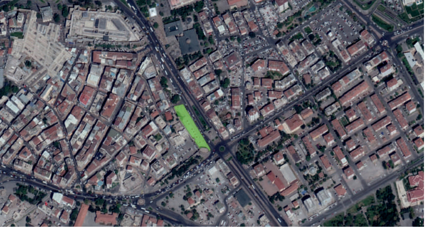
Resim 2. Yarışma alanına ait uydu fotoğrafı (yeşil renk ile taralı alan yarışma alanı sınırlarını göstermektedir.)

Kayseri Büyükşehir Belediyesi ve Melikgazi İlçe Belediyesi sınırları içinde olan yarışma alanı, Seyyid Burhaneddin Bulvarı ile Kayseri dış kale surları arasında kalan, surlara paralel uzanan alandır. Diğer bir anlatımla, Seyyid Burhaneddin Bulvarının güneybatısında, Yoğunburç Caddesinin kuzeybatısında, Seyyid Burhaneddin Bulvarının ve Yoğunburç Caddesinin kesiştiği noktada yer alan Yoğunburç Kavşağı ve Alaca Kümbet karşısında, dış kale surlarına ve Seyyid Burhaneddin Bulvarına paralel uzanan kapalı otopark alanının üzerinde kalan kısım yarışma alanı olarak belirlenmiştir. Bu alan, şartname eki, "5. Uydu Fotoğrafları ve Yarışma Alanı" dosyası üzerinde işaretlenmiştir.