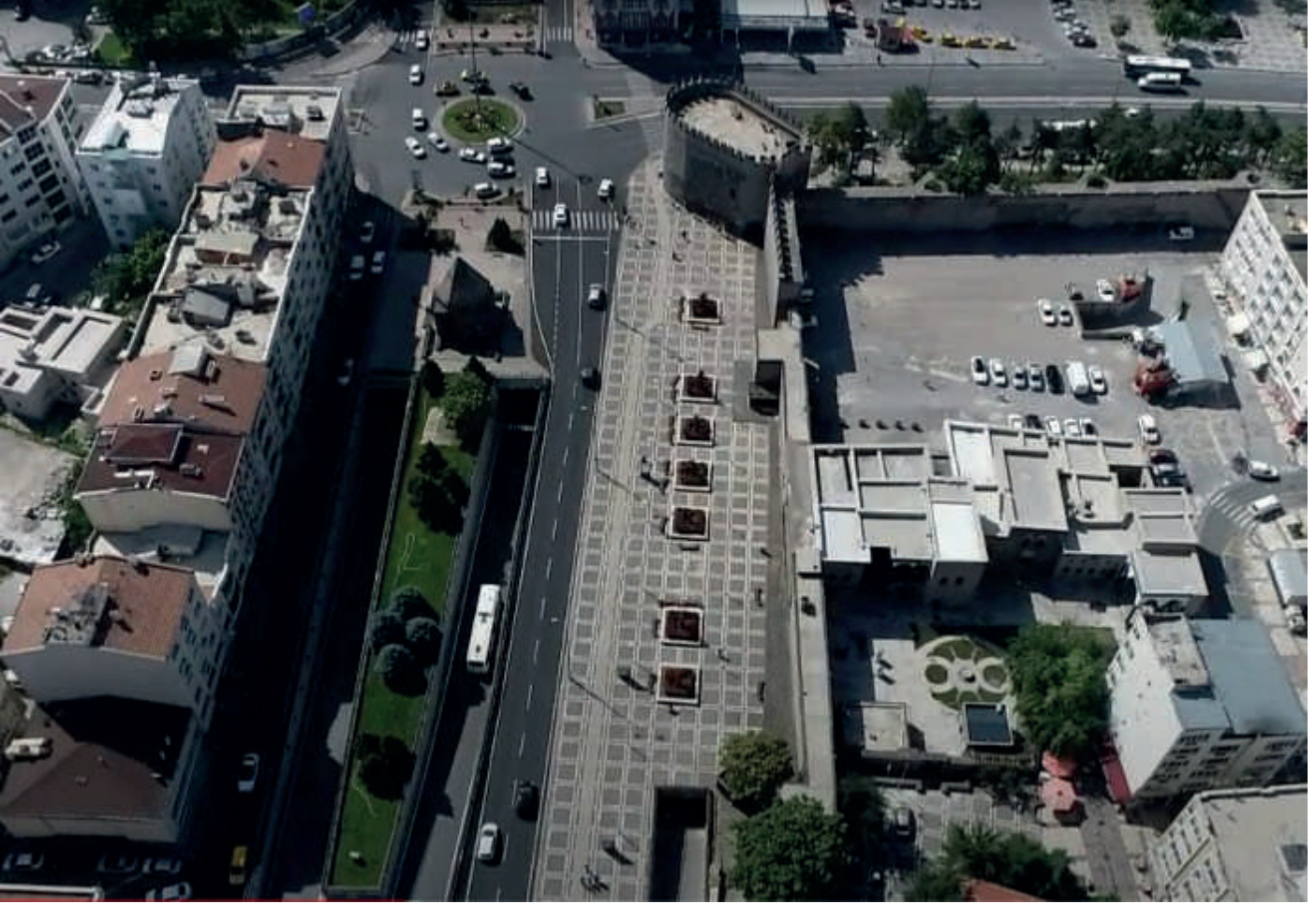
Resim 1. Yarışma alanı ve yakın çevresi

Kayseri Melikgazi Belediyesi ve TMMOB Mimarlar Odası Kayseri Şubesi kolektif katılımıyla duyuruya açılan "KAYSERİ MELİKGAZİ BULUŞMA NOKTASI ULUSAL FİKİR YARIŞMASI" ile, kentte yaşayanların yarışma alanı olarak belirlenmiş bölgede buluşmalarına olanak sağlayan, yerin özellikleri üzerinden geliştirilmiş, şu anda atıl olan alanın kullanımına farklı işlevler getirecek çağdaş ve yenilikçi tasarımlar üretilmesi amaçlanmaktadır. Yarışma konusu çerçevesinde, güzel sanatların teşviki, kültür, sanat, bilim ve çevre değerlerinin rekabet yoluyla geliştirilmesi ve ilgili mesleklerin gelişmesi için uygun ortamın sağlanması amaçlanmaktadır.